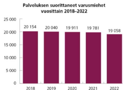
Kuvio 3.3.1 Palveluksen suorittaneet varusmiehet vuosittain 2018–2022