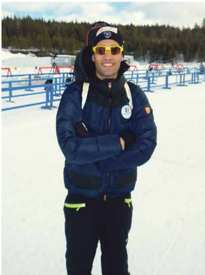
Kun mies on kunnossa, hän jaksaa hymyillä kilpailusuorituksenkin jälkeen.