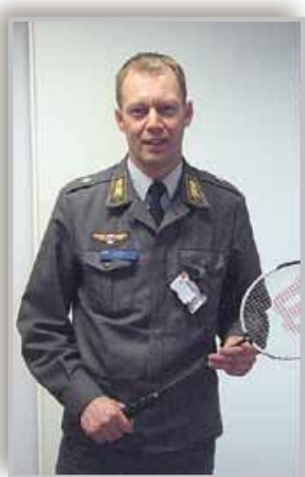
Uusi liikunta-päällikkö on urheilun moniottelija