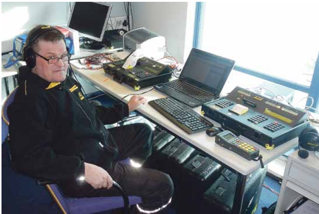
Ajanotto- ja tulospalvelun maestro valtakunnassaan.