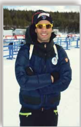
Mestari otti omansa Kommatti-vaarassa